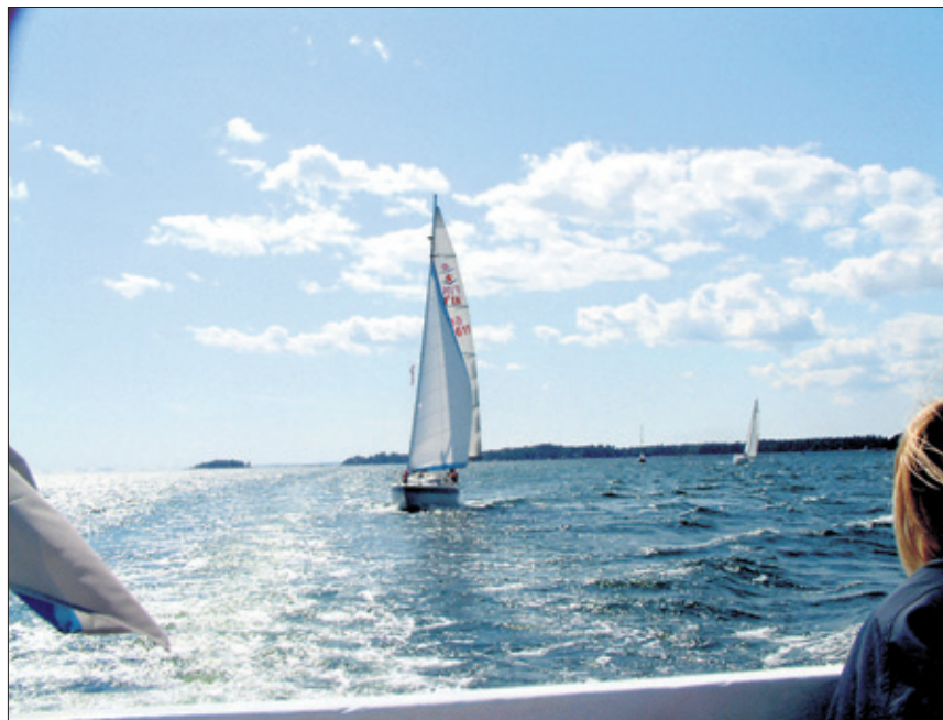
Espoon saaristossa voi nauttia kauniista maisemista ja myös muista aluksista, jotka lipuvat rauhallisesti ohitse.