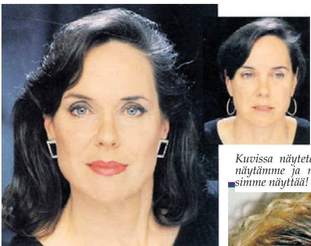
Kuvissa näytetään miltä näyttämme ja miltä voimme näyttää!

Voit olla vaalea taivaansininen kesä, todellinen kultainen kevät, eloi-