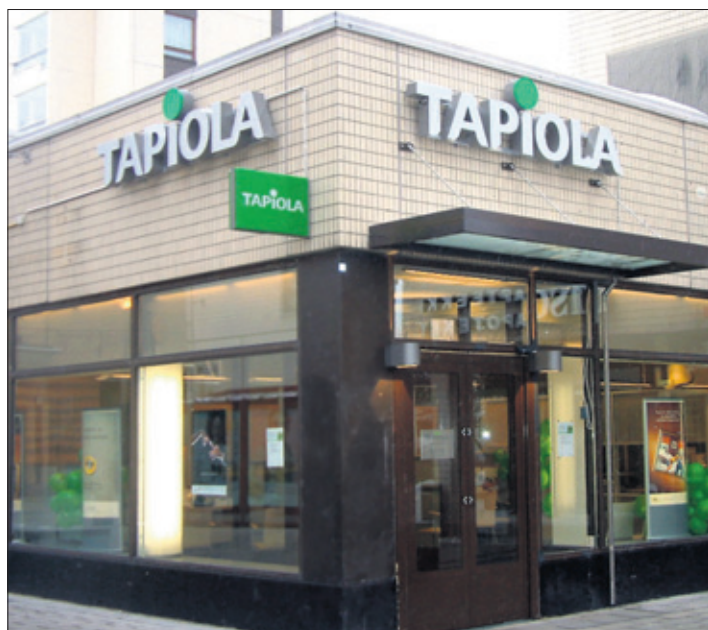
Tapiola-ryhmä on avannut uuden asiakaspalvelupisteen Tapiolan keskustaan osoitteeseen Länsituulentie 6.