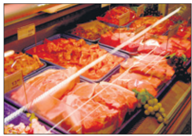
Lihaosaston erikoisuuksina ovat nautaan ja porsaanlihapihvit eri marinadeissa. Kaupalla on tiiviit suhteet myös eri tavarantoimittajiin ja sen vuoksi liikkeessä on usein tarjolla erilaista riistalihaa, hirvenlihaa, poronlihaa sekä lammasta.