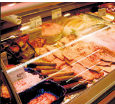
Kalaosastolta löytyvät monen moiset tuorekalat sekä graavi- että savustetut kalatuotteet.