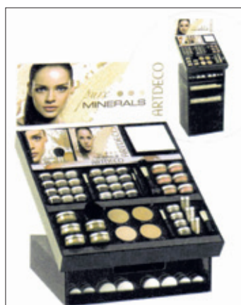
Art Deco -mineraalimeikit ovat hajusteettomia ja luonnollisia tuotteita ja ne sopivat hyvin myös herkälle ihotyypeille.