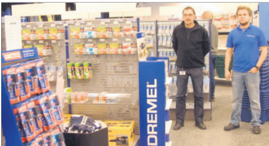
Otaniemen raudan valikoimien määrä nousee 12 000 tuotteeseen ja ne on saatavissa suoraan myymälän varastosta.

Tarjoukset voimassa Joulukuun 23.12.2010 saakka, tai niin kauan kuin tuotteita riittää