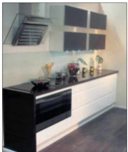
Tyylikäs, toimiva ja edullinen Herta-keittiö asiakkaan toivomusten mukaan.