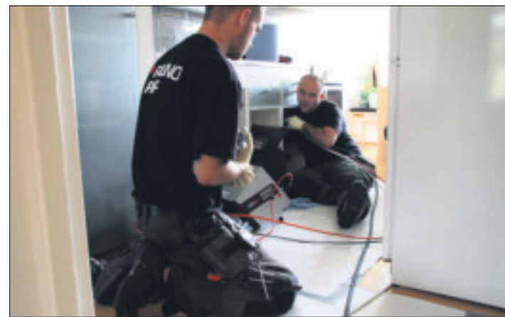
Tässä uusitaan keittiön viemärihaaraa ruiskuvalamalla.

Ruiskuvalussa viemäri puhdistetaan kaikista ruosteesta ja vuosien saatossa putkistoon kiinnittyneen aineesta, jotta saamme niin sileän ja puhtaan metallipinnan kuin mahdollista. Sen jälkeen putket pinnoitetaan lasivahvisteisella polyesterimuovilla. Kaikki viemäriin jatkokset ja mutkat saavat sisäpintoilleen tasaisen ja peittävän muovipinnoitteen. Polyesterimuovi on vahvaa ja kestää hyvin sekä mekaanisen et-