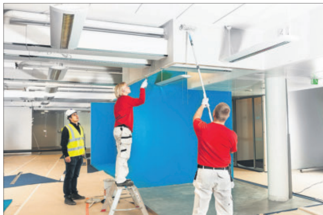
A-Saneerauspalvelut Oy toteuttaa vaativatkin saneeraukset sovituksessa aikataulussa sekä kustannus- ja laatutasossa.

Turvalaaksonkuja 2, Vantaa, puh. 010 386 8700 www.akumppanit.fi • www.raksapuoti.fi