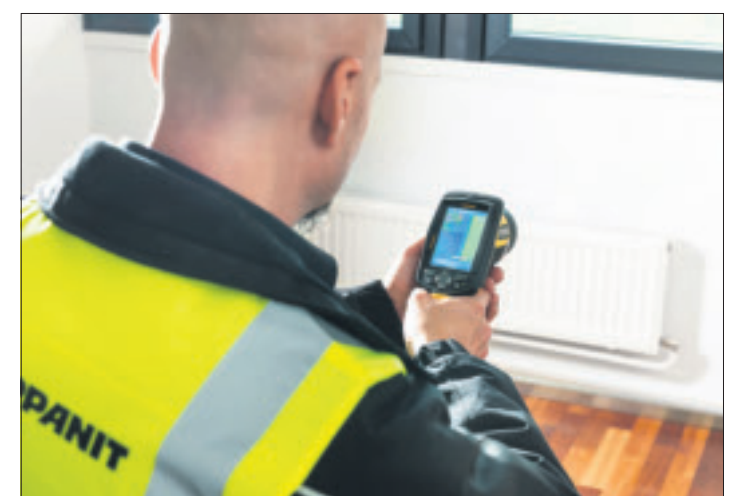
A-Kunnostus- ja kuivauspalvelut Oy korjaa vesivahingot ja homeongelmat alan uusimman tietämysten ja vastuullisen toiminnan avulla.

Esimerkki yhteistyöstä on A-Tuotteet ja laitteet Oy, jonka ylläpitämässä verkkokaupassa myydään yhteistyöyritysten tuotteita työkohteisiin. Raksapuoti-verkkokaupasta voivat myös yksityishenkilöt tilata esim. kosteutta kestäviä tapet-