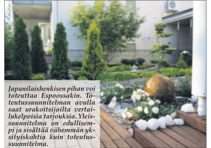
Japanilaishenkisen pihan voi toteuttaa Espoossakin. Toteutussuunnitelman avulla saat urakoitsijoilta vertailukelpoisia tarjouksia. Yleissuunnitelma on edullisempi ja sisältää vähemmän yksityiskohtia kuin toteutussuunnitelma.

– Edullisemmat luonnos- tai yleissuunnitelma eivät sovellu urakka laskentaan sillä ne eivät sisällä urakalaskennassa tarvittavia tietoja. Jos aikoo teettää pihansa ammattilaisen avulla ja haluaa saada vertailukelpoisia tarjouksia urakoitsijoilta kannattaa teettää toteutussuunnitelma . Toteutussuunnitelman tulisi sisältää: Mittakaavassa olevan suunnitelman jossa kaikki rakentamiseen tarvittavat mitat ja eri alueiden neliot ovat määriteltyinä.