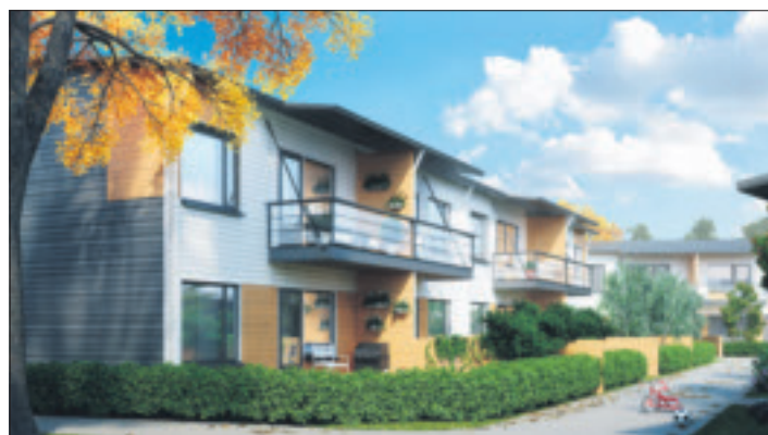
Havainnekuva Hartelan Espoon Painiityyn Kotipuu-kodeista.

– Kotipuu-kotien edullisempi hinta perustuu yksinkertaiseen ideaan: loppuun saakka hiottu