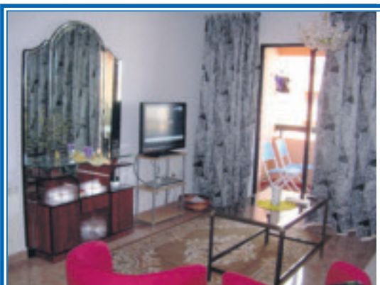
Asunto on kalustettu kauniisti.

Espoon kaupunki on sitoutunut seudun kuntien ja valtion väliseen aiesopimukseen, jonka mukaan keskimääräinen asun- totuotantotavoite on 2 500 asuntoa vuodessa. Aiesopimuksen mukaisen valtion tuella rakennetun vuokra-asuntotuotannon (ARA-vuokra-asuntotuotanto) tulee olla vähintään 20 % eli noin 500 asuntoa vuodessa koko tuotannosta. Jotta haasteeseen pystytään vastaamaan, on kaavoitustavoitteena kaupunginhallituksen tila- ja asuntojaoston hyväksymä uuden asuntorakennusoikeuden osalta 350 000 k-m 2 vuode- sa. Lisätietoja: http://espoo04.hosting.documenta.fi/kokous/TELIN-214778.HTM