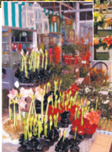
Bieder kukkakaupoissa joulukukista, joulukoreista, kimpuista ja asetelmista on runsaat valikoimat.

Tervetuloa Bieder kukka- kaupoihimme, joista asiakkaat löytävät kukat mukaan vietäviksi tai tilauksesta lähelle tai kaukaa.