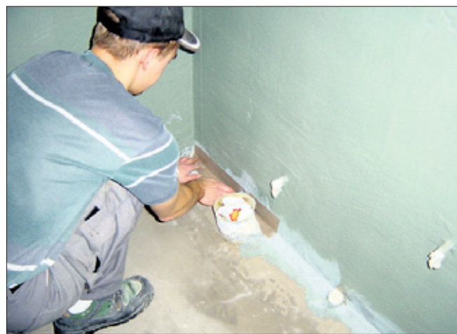
Kylpyhuoneremontissa vesieristys on ammattilasten työtä.

mistopäällikkö Pirjo Pennanen Espoon verotoimiston henkilöverotuksesta.