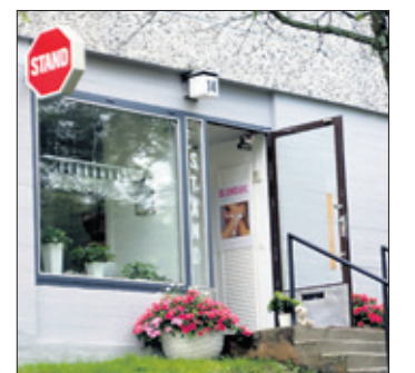
Kampaamo-parturi Standin tiloihin Matinkylässä osoitteessa Matinraitti 14 on helppo tulla bussilla ja auto-paikoitustilojakin on lähellä.

Teksti: Seppo Hauta-aho, Webbinetti S&T Ky