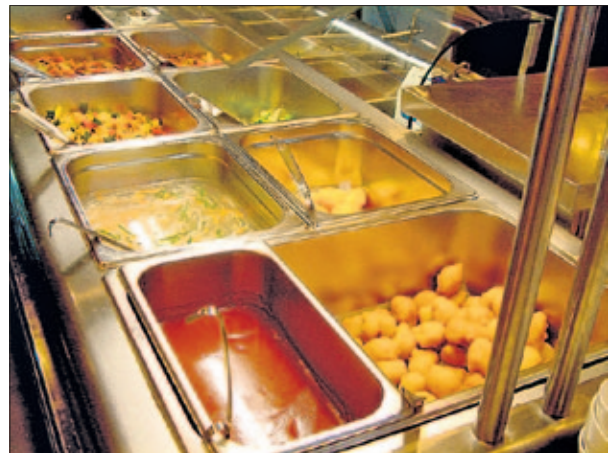
Buffet-lounas sisältää monipuolista herkullista kiinalaista ruokaa.

Ravintola Fusion Square sijaitsee keskellä Tapiolaa, Tapiontori 3 B:ssä puh. 855 0038, fax 455 3885.