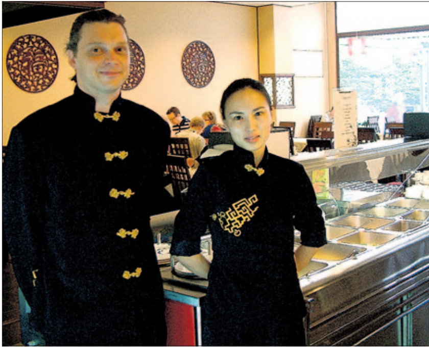
Ravintola Fusion Squaren henkilökunta valmiina palvelmaan.

Ravintola Fusion Squaren suosittu Buffet-lounas ja a la carte listan ruuissa kiinalainen ruoka maistuu aidoimmillaan. Ravintola on myös suosittu kiinalaisten asiakkaiden keskuudessa, jotka Suomessakin haluavat nauttia kiinalaisista herkuista. Lounaspöytä sisältää kuusi lämmintä ruokavaihtoehtoa, riisi, nuudeli ja kasvislajikkeita sekä runsas salaattipöytä, keitto, jälkiruoka ja kahvi. Buffetpöytä on tarjolla arkisin klo. 11.00–15.00. A la carte herkuista voi nauttia iltamyöhään saakka. Ravintolan ruokalista on uudistettu. Keittiön uutuuksia ovat mm. Vietnamilainen nautanliha, parasta nautanlihaa taidokkaasti mustapippurilla maustettuna ja "Big Plate Chicken", suuri kanalautanen nuudeliä kera. A la carte listan herkkuja on kaiken kaikkiaan tarjolla sata erilaista annosta. Ruokalistan suosik-