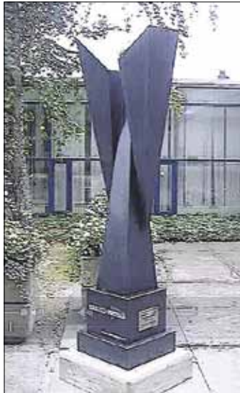
Kaunista Enkelipatsasta voi ihail- la Tapiolan Kirkon pääoven edes- sä Tapiolan raitilta katsoen kirkon etupihan vasemmassa kulmassa kol- men puun katveessa.