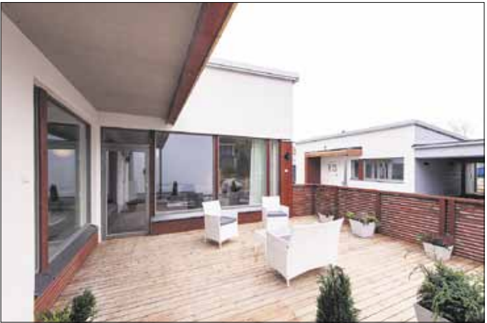
Mankkaalle on valmistunut upea 12 asunnon yhtiö, jossa on vielä muutama yksitasoinen asunto vapaana. Vieraiselle tontille valmistuu keväällä 2017 samankaltainen sisaryhtiö, johon tulee 10 asuntoa kokoluokissa 90-109,5 m 2 . Mh. alk. 267.664 €. Vmh. alk. 519.000 €. Sovi esittely sisustettuun mallihuoneistoon! Tied. 09 452 0700