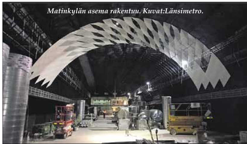
Matinkylän asema rakentuu.