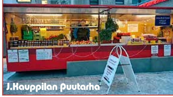
J. Kauppilan puutarha

Pakastemarjat (mansikka, mustikka, vadelma, tyrni) Hillot Suolasieni Täysmehut Karpalo Puolukkasurvos Kotimainen Omena Pakastekuivatut marjat Marjajauheet Myymlä avoinna maaliskuun ajan Tapiolan Akti pankkia vastapäätä TO - PE - LA 10-17