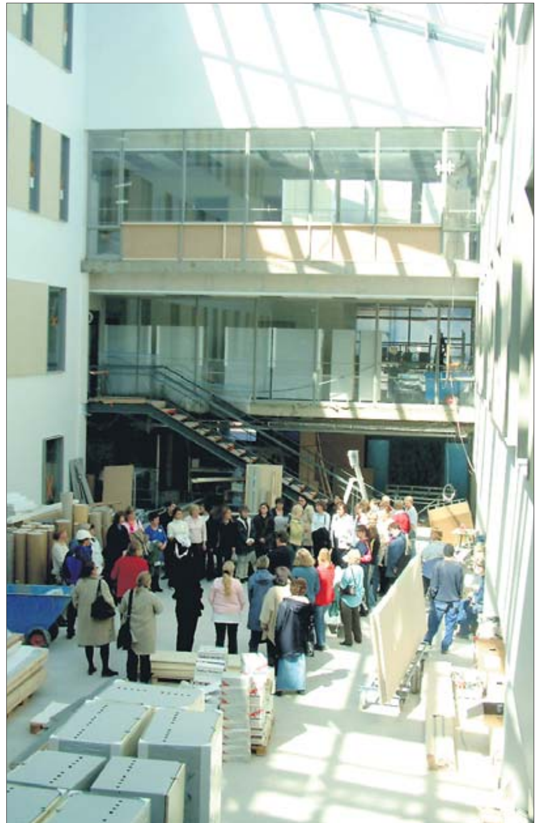
Uusi Tapiolan terveyskeskus avataan Pohjantien ja Ahertajantien kulmassa 3.10.

Tapiolan Lähiseudun Asiakaslehti Peter Wellmann Sateenkaari 3 A 26, 02100 Espoo tapiolan-lehti@tapiolan.com Voit myös tiedustella lisätietoja puh. 050-589 7543